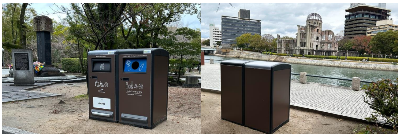
平和記念公園に初導入されたスマートゴミ箱「SmaGO」

2025 年に「被爆 80 周年」という重要な節目を迎えたことを契機に、公園の静謐な環境と美しい景観を将来にわたって守っていくため、企業 3 社がスマートゴミ箱「SmaGO」の寄贈を決定し、設置が実現しました。