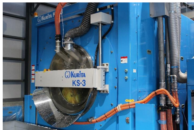
【クリタサムズシステム®実機外観】

3社は、互いの強みやネットワークなどを活用し、本装置への関心や需要のある廃棄物処理業者や地方自治体へアプローチするとともに、SMFL グループのファイナンス機能を活用した本装置導入にあたっての幅広い選択肢を提供し普及を促進することで、使用済み紙おむつのリサイクルを通じた循環型社会の実現への貢献を目指してまいります。