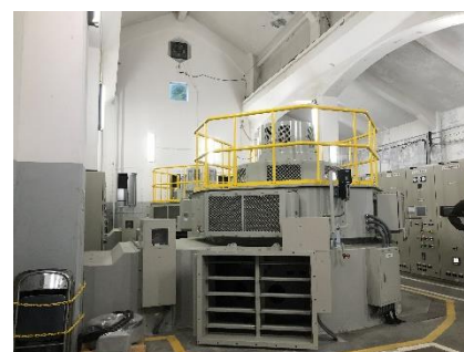
発電設備(第二発電所)