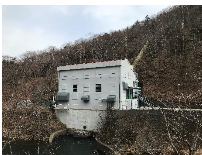
発電所建屋外観(第三発電所)